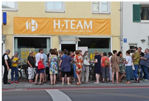
H-TEAM e.V. Eingangsbereich