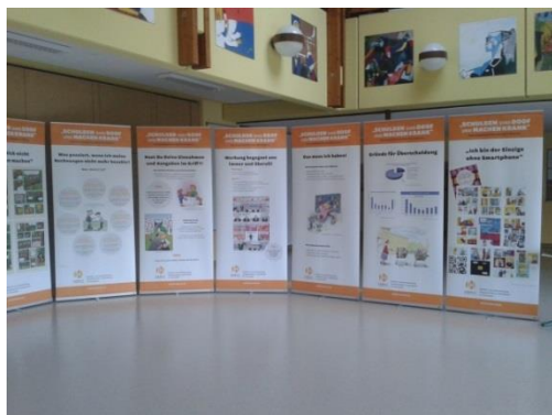
Wanderausstellung Schulden sind doof und machen krank