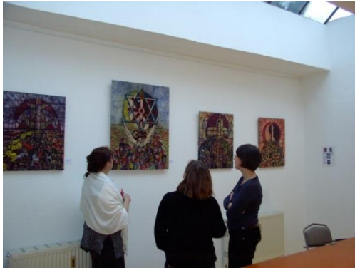
Eine der ersten Ausstellungen im H-TEAM e.V.