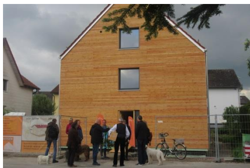
Richtfest Haus Amara