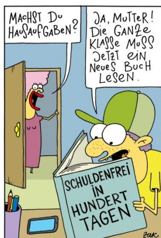
Comic zum Thema Schulden sind doof und machen krank