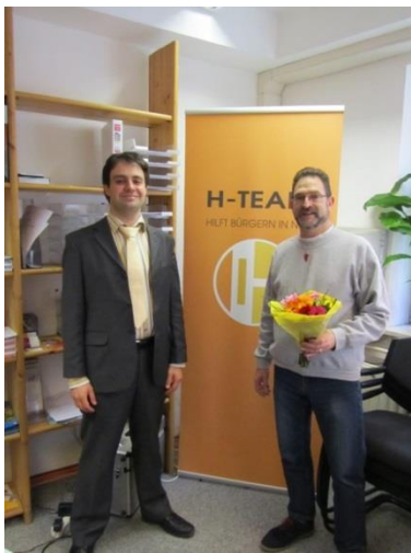
3000ste Rechtsberatung im H-TEAM e.V.