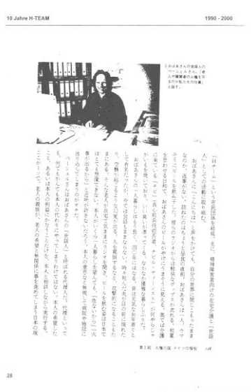
Auszug aus der 10-Jahres Broschüre