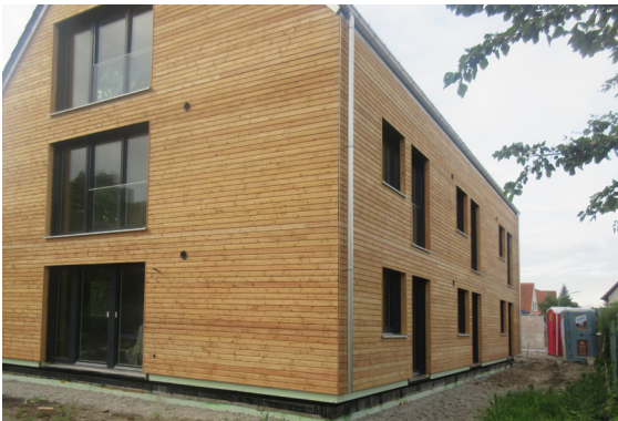
Haus Amara/ H-TEAM e.V. Richard- Strauss-Str. 4 85356 Freising (Stadtteil Lerchenfeld)

Unser Angebot richtet sich an Männer und Frauen ab dem 21. Lebensjahr, die auf Grund einer psychischen Erkrankung regelmäßige Unterstützung benötigen. Zur Zielgruppe zählen insbesondere: Männer und Frauen mit psychischer Behinderung aus dem Raum Freising, die eine betreute Wohnform suchen; Personen mit einer psychischen Erkrankung, die mit der Haushaltsführung überfordert sind und praktische Unterstützung benötigen; psychisch kranke Männer und Frauen, die gerne in einer Gemeinschaft wohnen möchten, aber nicht den beschützenden Rahmen einer stationären Einrichtung brauchen.